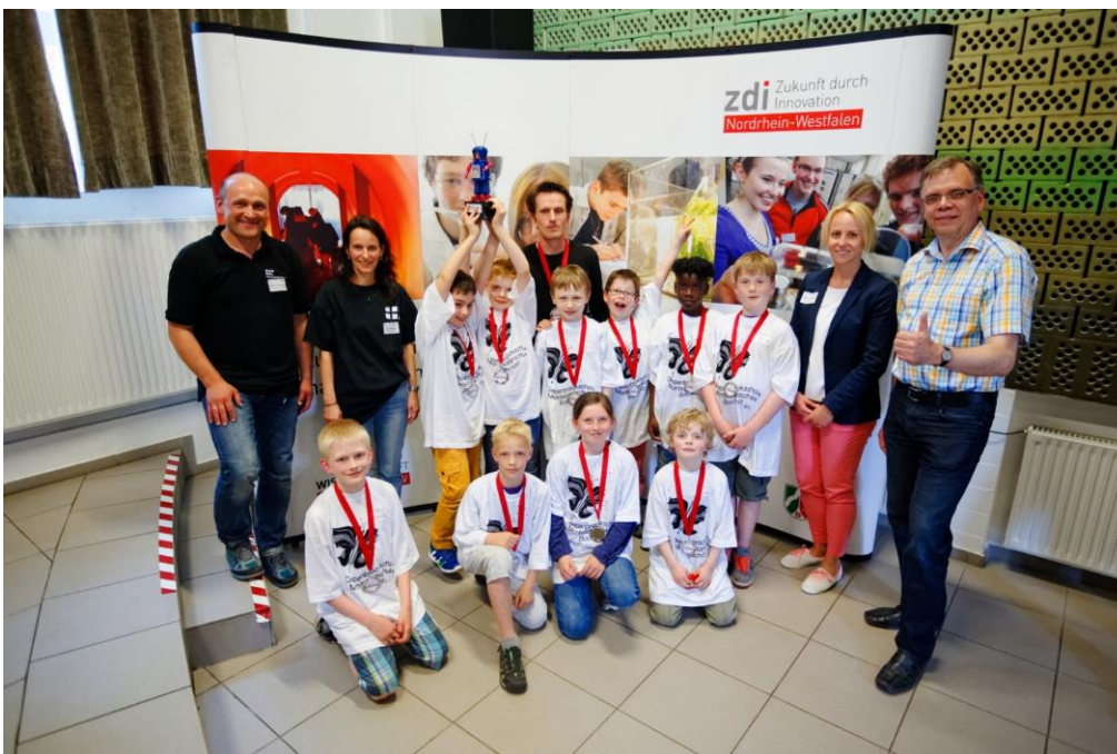
Bildunterschrift: Das Team R2D2 vom Grundschulverbund Diepenbrock aus Bocholt erzielte den ersten Platz beim „Robot Game“.

Wirtschaftsförderungsgesellschaft für den Kreis Borken mbH